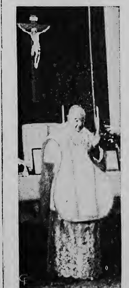
Samuel Cardinal Stritch ta hasiendo su prome sacrificio di misa despues cu su brazo a worde amputa na Roma. Despues di misa e la hanja un ataka.